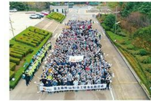
丰富多彩员工活动