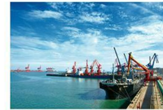
公司专用木片码头一角