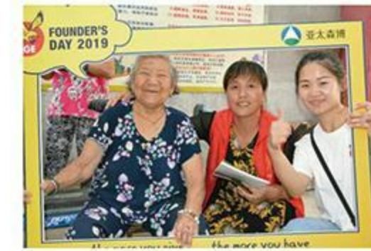
践行企业社会责任