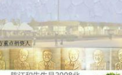
陈江和先生是2008北京奥运场馆“水立方”的第一位大额捐赠人。