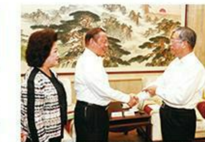
2017年8月31日，山东省委书记刘家义在济南亲切会见陈江和主席一行。