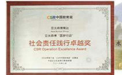
2016年，“圆梦行动”荣获第二届CSR中国教育奖社会责任践行卓越奖。