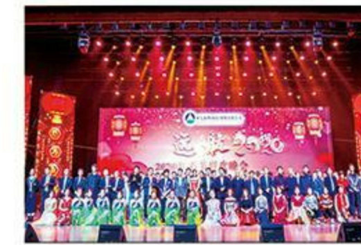
一年一度公司春晚