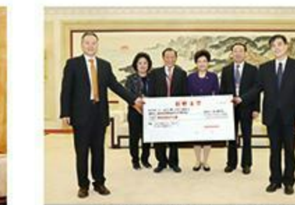
2018年9月28日，陈江和主席与省委常委、统战部部长邢善萍会见。