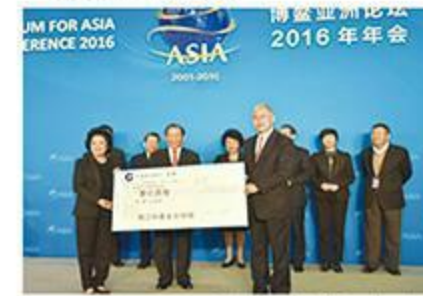
2016年，陈江和基金会向中国华文教育基金会捐赠1亿元用于“一带一路”人才培训项目。