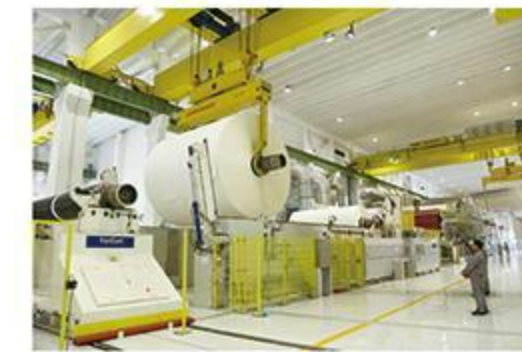
新建成的液体包装纸板车间