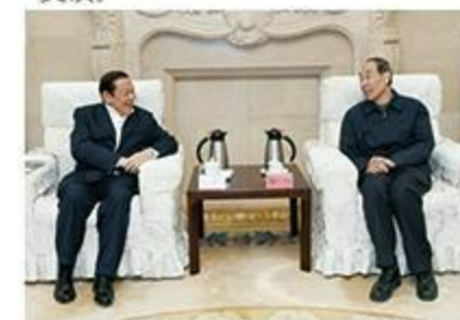
2019年4月3日，中共中央书记处书记、中央统战部副部长尤权会见陈江和主席。