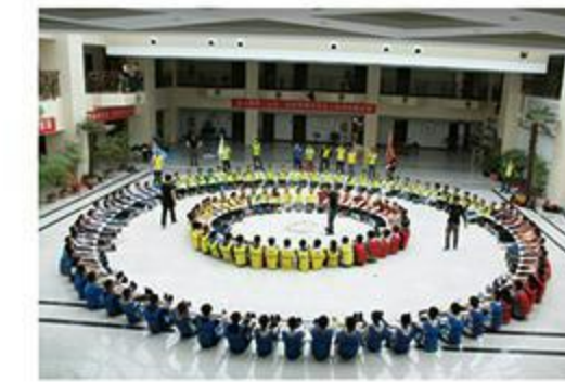
公司全员旅游拓展