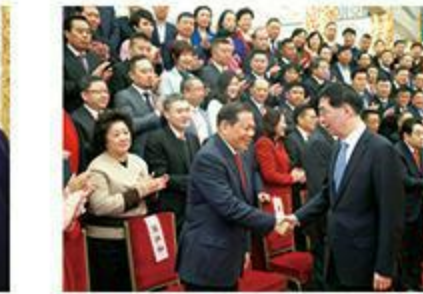
2019年11月，中共中央政治局常委、中央书记处书记王沪宁与陈江和主席亲切握手。