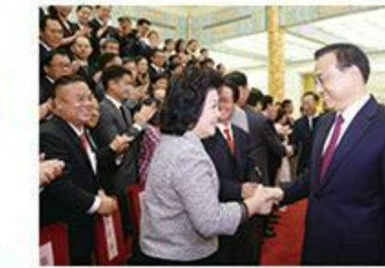
2015年7月，国务院总理李克强与陈江和主席夫人黄瑞娥女士亲切握手。