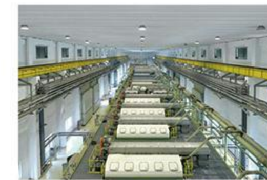
世界规模最大的制浆车间之一